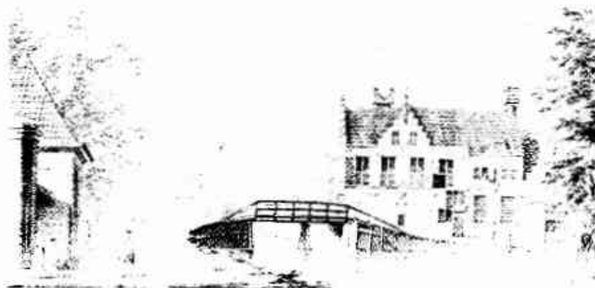
De Nieuwe Tollweg op de grins tussen Voorburg en Rijnwijk, ca. 1750. Tekening van J. van Conope, ingezonden door J. Buijs. Achter de muur links de buitenplaats Dierholt, rechts Burekholst, dat als tothuis fungeerde.

De excursie kan doorgaan indien zich minimaal 40 deelnemers aanmelden. Deelname in volgorde van binnenkomst van de opgaveformulieren (zie hierna). Bij aanmelding van meer dan 48 personen hebben leden voorrang op niet-leden.