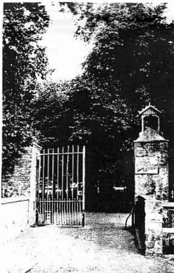
De toelaten de Linn van Nieuw Oosteinde, opgeheten in 1928.