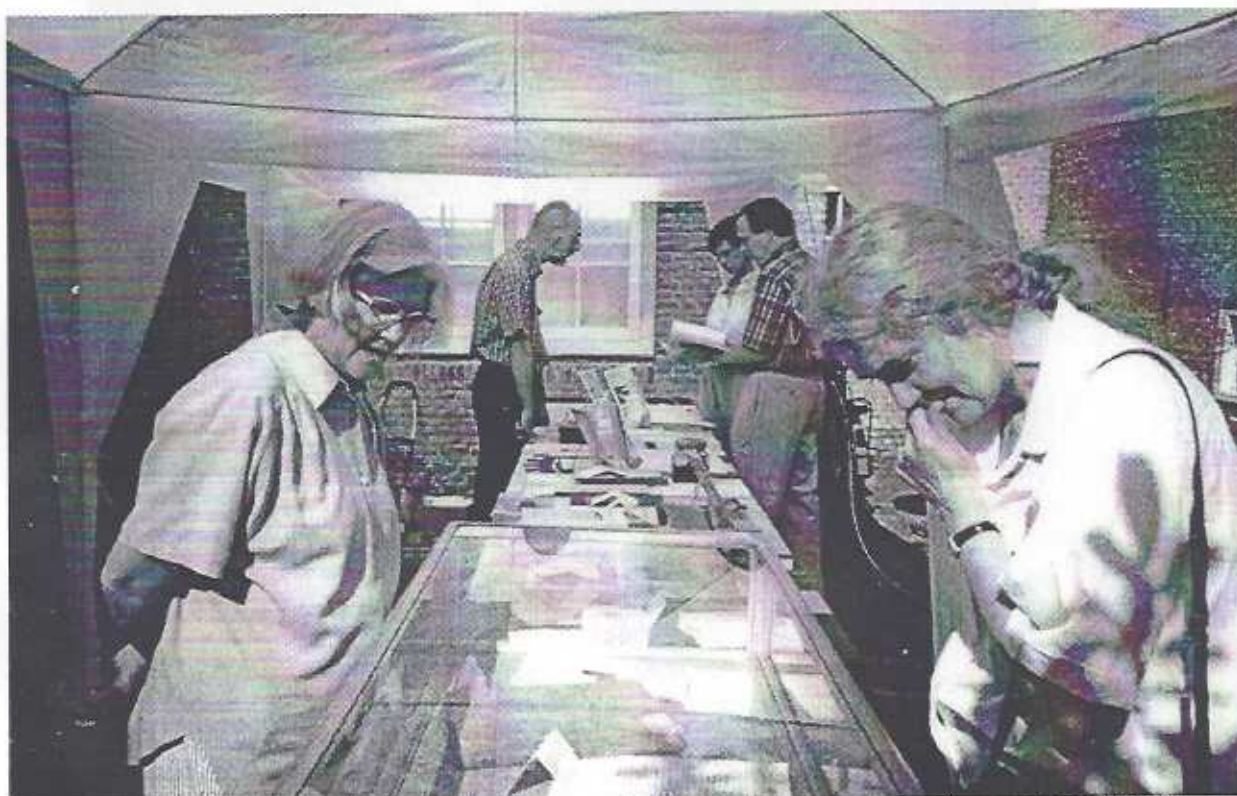
Stand van de Historische Vereniging Voorburg op de binnenplaats van Huize Swaensteyn tijdens Open Monumentendag 1999, er zijn die dag weer 11 mensen lid geworden.