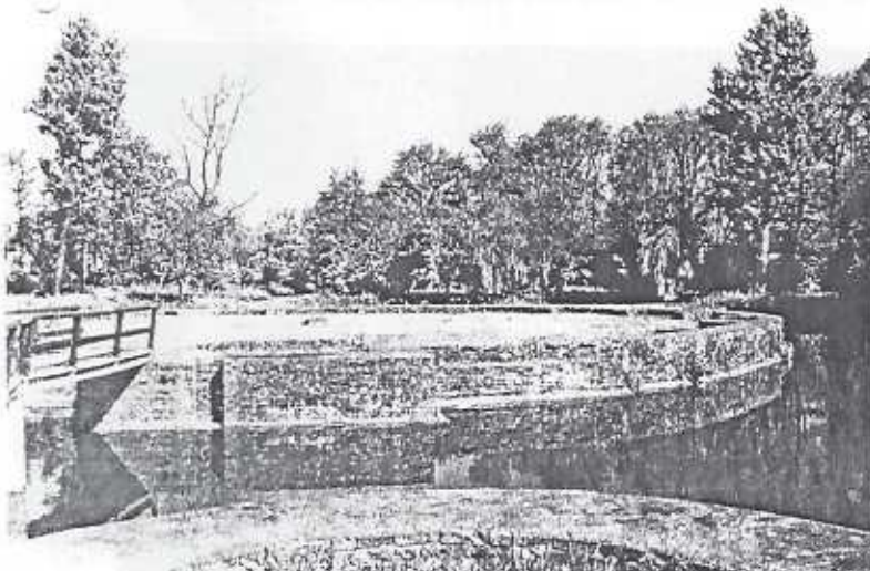
Egmond aan de Hoef, slotruïne uit de 11e eeuw.

Voor de lunch was ook een historische omgeving gekozen: een restaurant met het interieur van het oude molenhuis. De molen zelf is niet meer in gebruik en bevindt zich achter het restaurant.