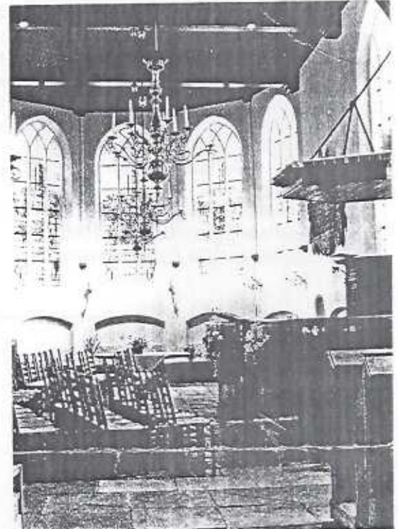
Interieur van de Slotkapel in Egmond aan de Hoef.

Hoogtepunt was de wandeling over de fundamenteën van de slotruïne, duidelijk zichtbaar gemaakt door een kleine stenen opbouw. Zo zijn oorspronkelijke omtrek en latere aan- en uitbouw goed te onderscheiden. Hoewel de meren die het slot omringden in de loop der eeuwen zijn ingepolderd, ervaar je nog steeds hoe markant deze plek is.