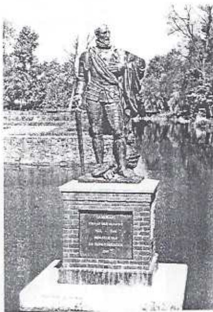
Graaf van Egmond, 1522-1568. Bedijker van De Egmondermeer in 1565.

zien. Jammer genoeg bleef de abdijkerk voor ons gesloten. Daarom was er tijd de permanente tentoonstelling in het Prins Hendrikoord te bezichtigen, nog steeds een tehuis voor gepensioneerde zeelieden. Op de eerste verdieping bevinden zich schilderijen met zeegezichten en een grote verzameling scheepsmodellen, van miniatuur tot vitrinevullend. Keurig op tijd leverde de chauffeur ons weer in Voorburg af. Een woord van lof voor de excursiecommissie die alles weer tot in de puntjes had voorbereid. Hun programma had zeker meer belangstellenden verdiend.